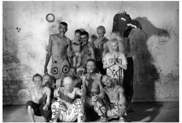
Cast of Freaky, 2012