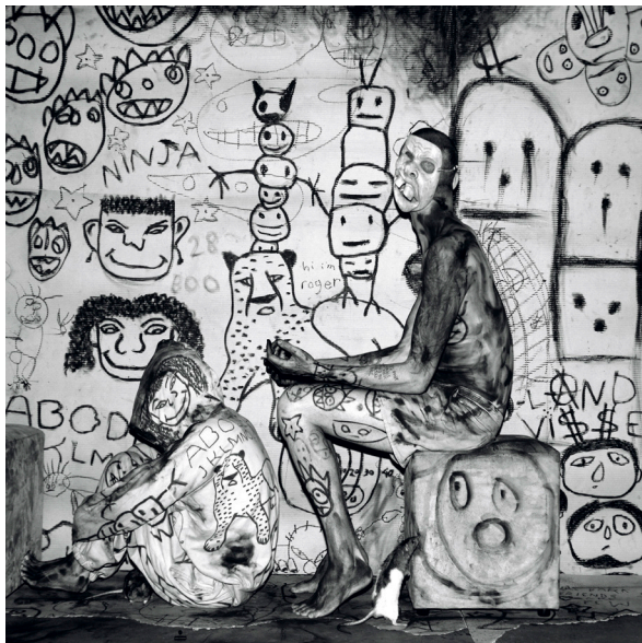
Die Antwoord, 2008