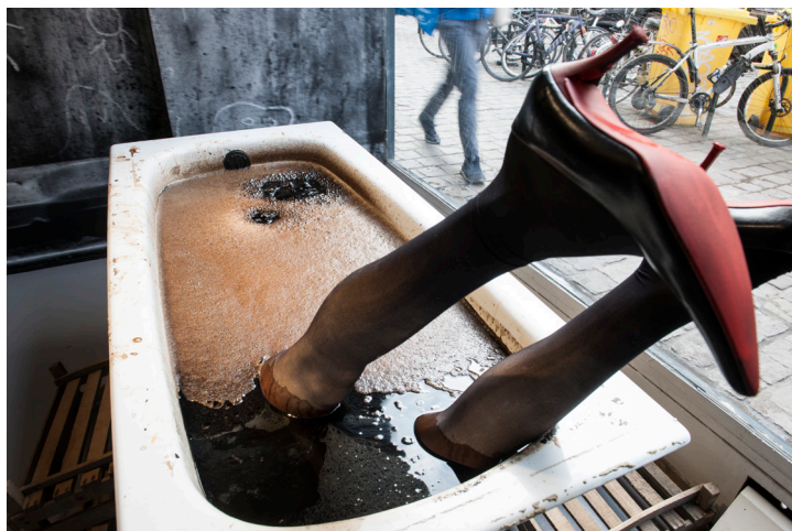
Installatie Die Antwoord @ CENTRALE, 2019