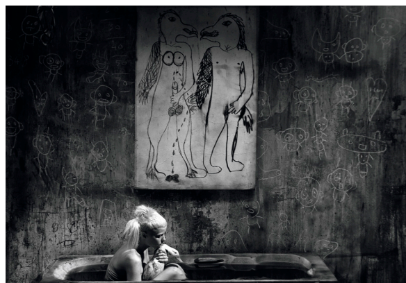
Bath Scene, 2012 © Roger Ballen

‘Die Antwoord and Roger Ballen are family, Mr Ballen is our Number 1, our favourite artist alive on this planet, our master, and our friend.’