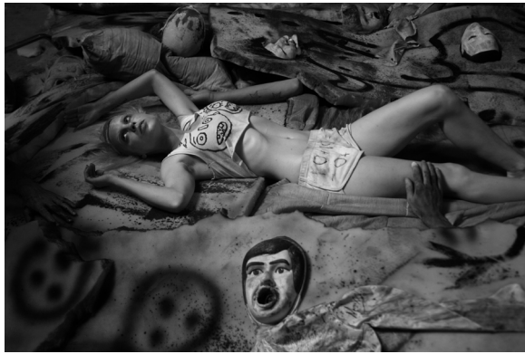
Yolandi and Sneaky Hand, 2012 © Roger Ballen