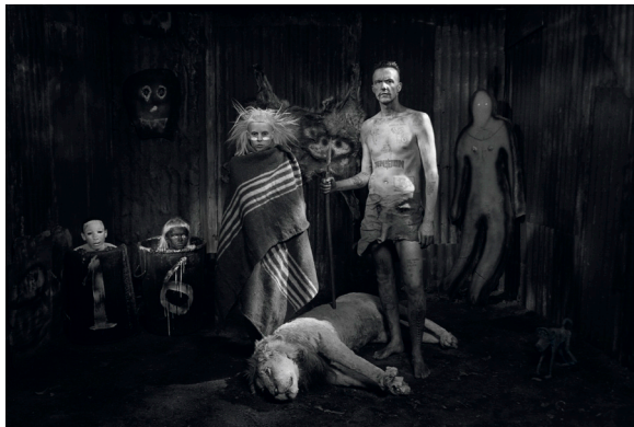
Shack Scene, 2012 © Roger Ballen